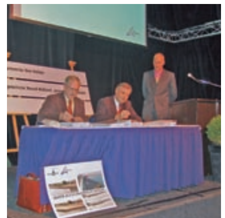
Het gunningscontract wordt ondertekend.

goed en efficiënt mogelijk uit te voeren, zodat Den Helder er straks goed mee voor de dag kan komen."